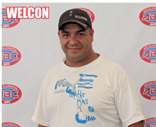
Chapa 1: Brutos